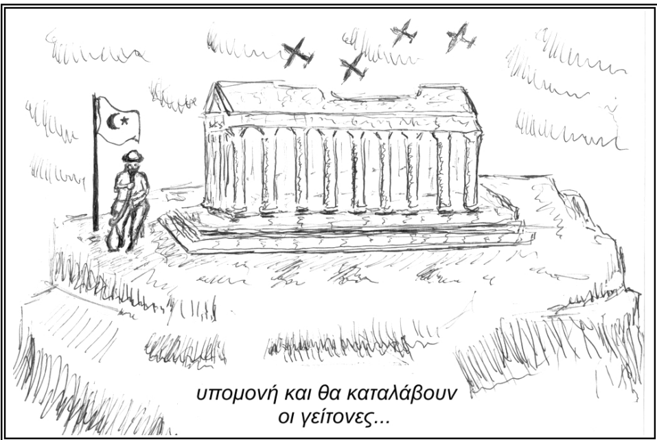
υπομονή και θα καταλάβουν οι γείτονες...