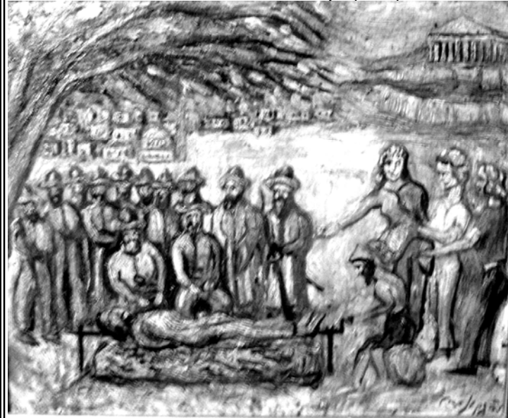
Πίνακας φιλοτεχνηθείς προ τριακονταετίας με τη λεζάντα: «νόμος περί ομοφυλοφίλων».