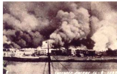
Ν. Ι. Κωστάρης

Υπεύθυνος ὕλης φυλλαδίου Γεώργιος Σ. Γκεζερλής Διεύθ: Σκρα 2 Μαροῦσι, Τ.Κ.: 15124, Τηλ: 210 6195766, vgezer@cc.uoa.gr