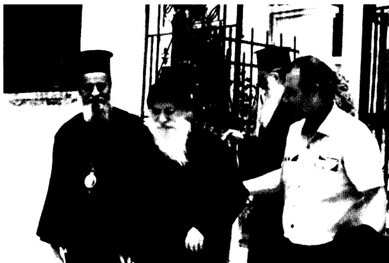
Vizitând Sfânta Mitropolie din Karystia