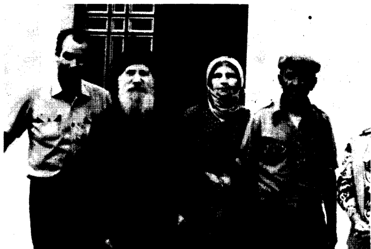
În excursie la Mănăstirea Sfintului Haralambie din Lefka, Evvia (1984).