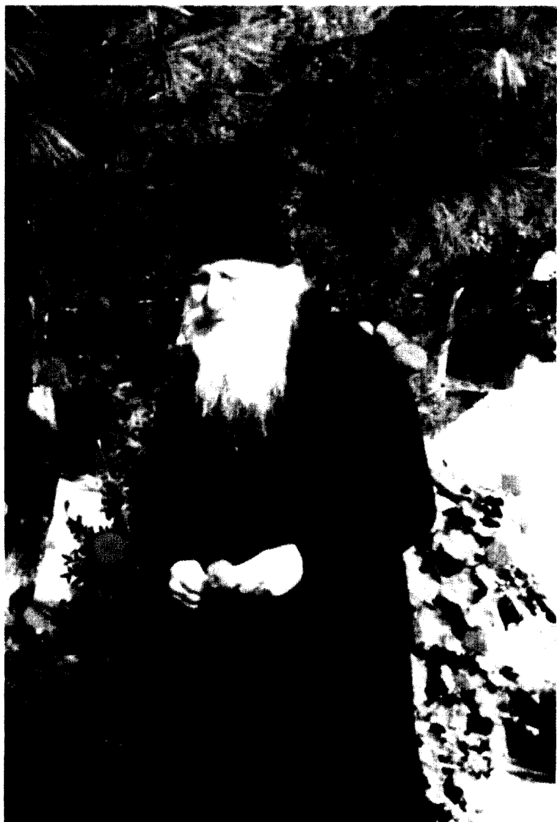
Momente de meditație în grădină. «Câteva crengi de mi-ar da, să-mi fie ultim locaș de odihnă...»