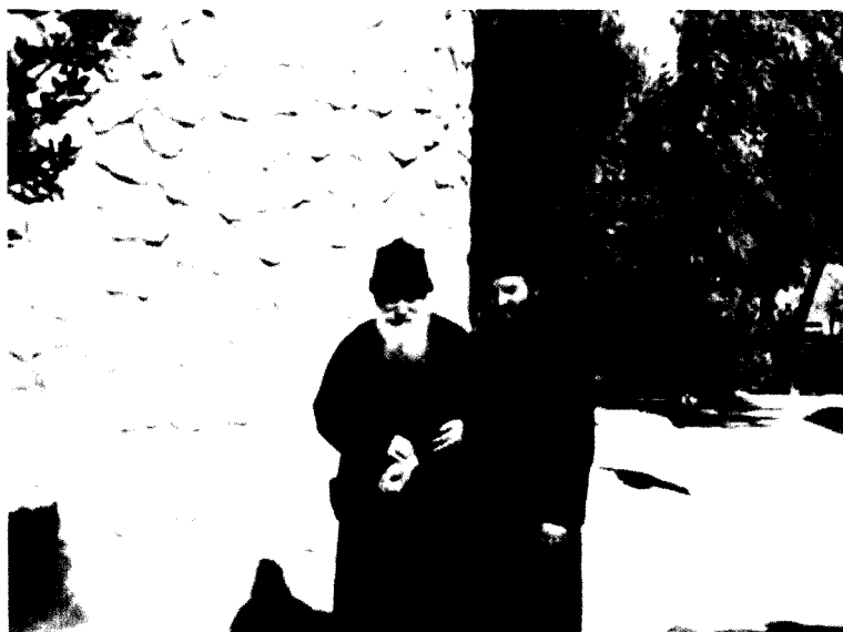
Părintele pune diagnostice luând pulsul. Plimbare și îndrumare.