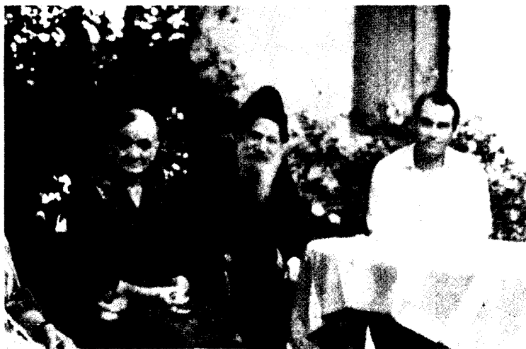
În excursie la Kamena Vourla