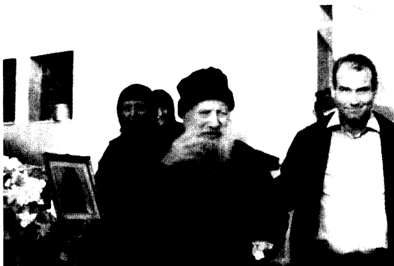
Bătrânul vizita adesea mănăstirile de maici, pentru a căror propășire se ruga neîncetat