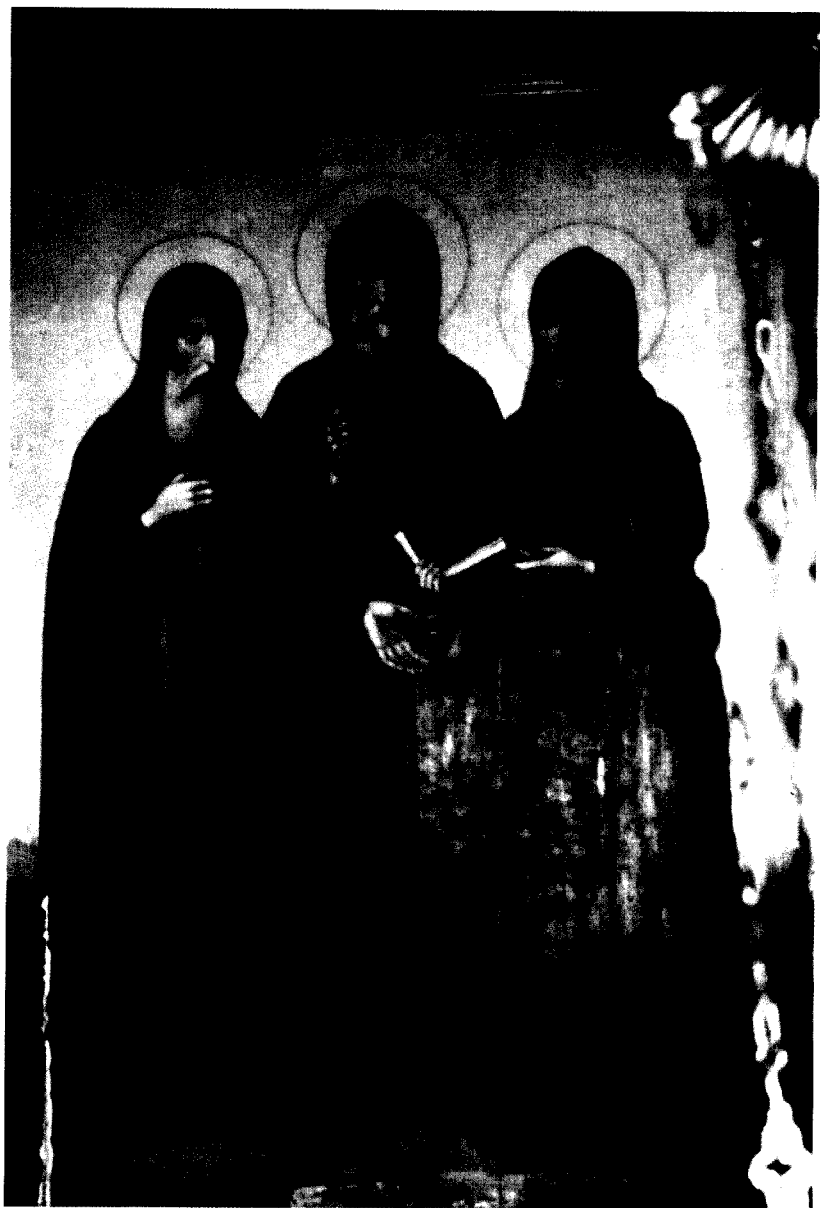
Sfinții Protectori ai Bătrânului Porfirie: Nifon Atonitul, Acachie și Maxim Kafsokalivitul