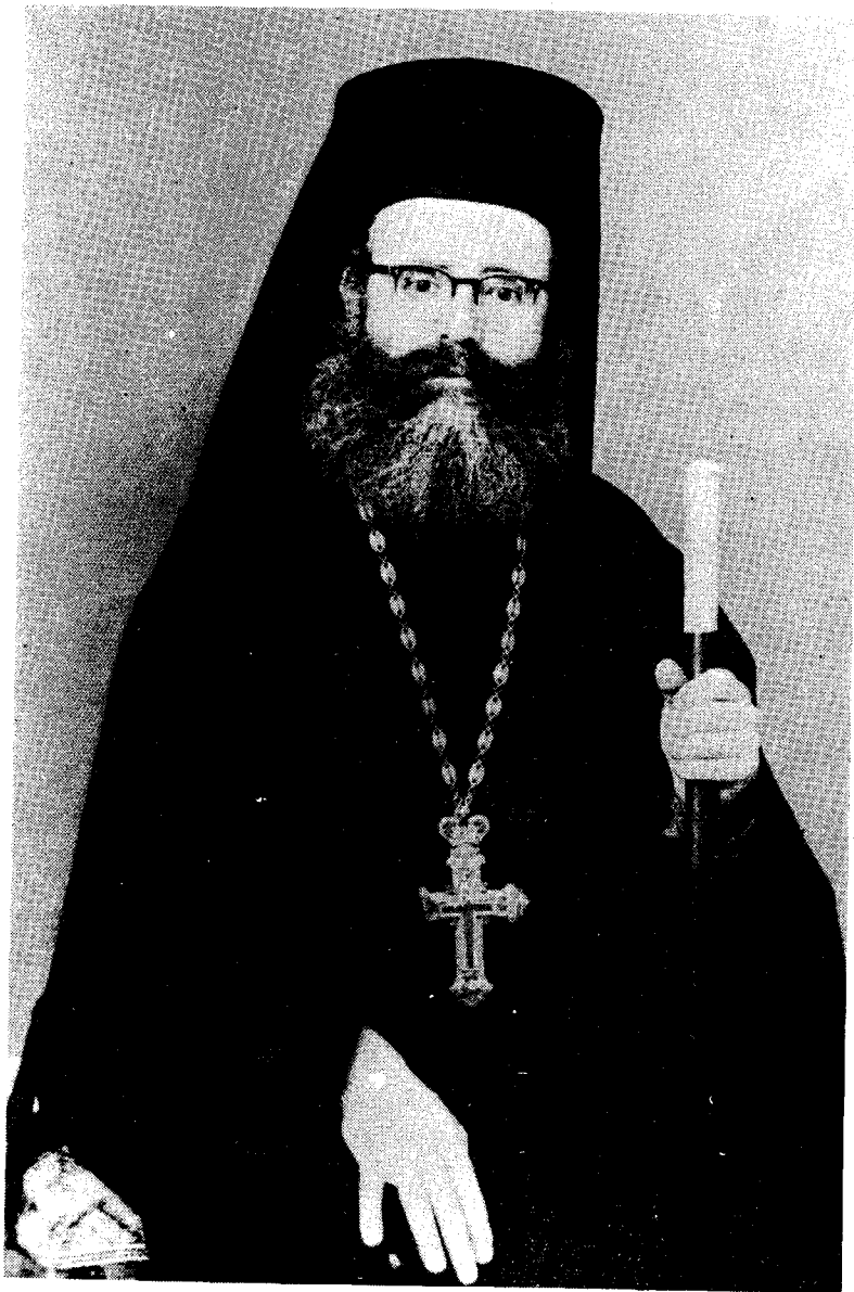
Ο Γέρων Ελπίδιος.