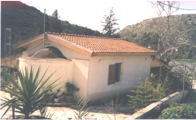
Το παλαιό, ἀπό τό Ζεῦγος Λ. Σκούρου.

Στή συνέχεια θά δοῦμε πῶς αὐτά τά θαυμαστά πράγματα ἀποκαλύφθησαν καί τά γνωρίσαμε στίς μέρες μας.