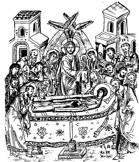
Ἡ ΚΟΙΜΗΣΙΣ ΤΗΣ ΘΕΟΤΟΚΟΥ

Ἱερομόναχος Ἰωάννης Κελλίον Κοιμήσεως τῆς Θεοτόκου Ἁγία Ἄννα - Ἁγίον Ὄρος