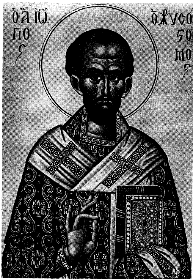
Ἔργον τῆς Ἀδελφότητος ΔΑΝΙΗΛΑΙΩΝ Ἀγίου Ὁρους

συνανθρώπων μας εκδίδουν τό πρακτικό αὐτό ἐνημερωτικό τεύχος πρὸς δόξαν Θεοῦ καὶ ψυχικὴν ὠφέλειαν ἐν Χριστῷ ἀδελφῶν μας.